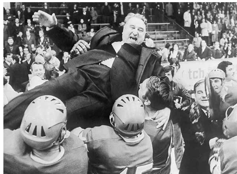
Анатолий Тарасов много выигрывал в хоккее – тренируя ЦСКА и сборную страны, но в футболе успеха ему добиться не удалось

Тарасов торжествовал недолго. Через тур ЦСКА играл в Киеве. Местные динамовцы только что завоевали Кубок кубков, а в составе сборной СССР, куда они входили всей командой, дважды победили в отборе к чемпионату Европы. В общем, были на ходу. Тарасов перед игрой пообещал тренеру «Динамо» Валерию Лобановскому, что его команда киевлян превзойдет. «Если только в разгрузке вагонов», – отшутился Лобановский. На футбольном поле от ЦСКА ничего не осталось. 30 ударов по воротам и убедительные 3:0 в пользу «Динамо», причем обошлось даже без обязательного гола Олега Блохина.