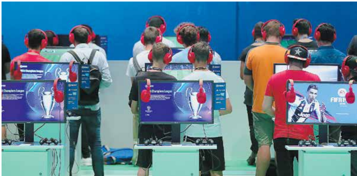
В начале февраля 2021 г. EA отчиталась о 325 млн проданных копий игр серии FIFA с момента выхода первой версии симулятора

Важность лицензий легко проследить на примере футбола. Долгие годы за сердца геймеров бьются две франшизы – FIFA (выпускается с 1993 г.) от EA и Pro Evolution Soccer (eFootball) от Konami, появившаяся в 2001 г. Фанаты есть у обеих серий, по продажам лидер очевиден: к примеру, в 2019 г. 12,22 млн проданных копий FIFA против 0,55 млн PES.