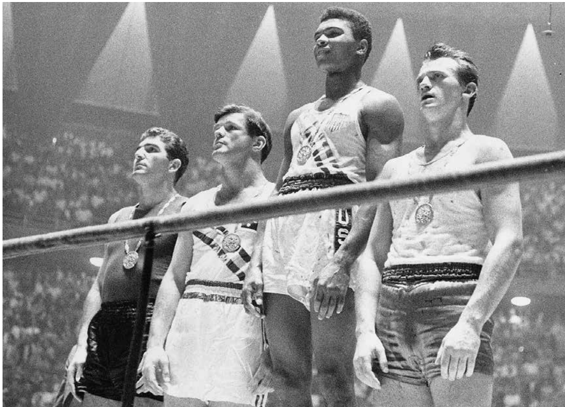
Мохаммед Али (в центре) — тогда еще Кассиус Клей — чемпион Олимпиады-1960

К Играм-1992 в послужном списке Оскара было одно поражение: