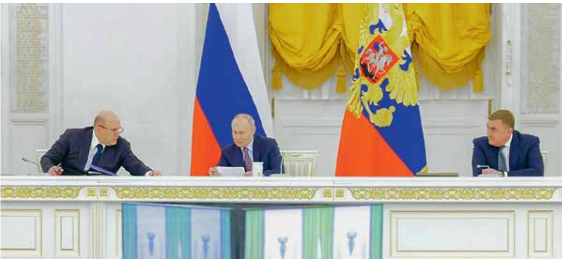
Владимир Путин на заседании Госсовета подчеркнул, что в ближайшей перспективе российская экономика напрямую зависит от решения демографической проблемы

считывалось 35,6 млн, а к началу 2024 г., по данным ЕМИСС, уже 33,36 млн. При этом, например, в 2006 г., когда разрабатывалась концепция демографической политики РФ на период до 2025 г., численность женщин данных возрастных групп составляла 39,4 млн человек. «Девочки нуж-