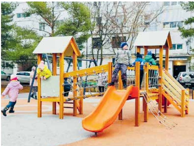
Сориентировать людей на многодетность сложнее, чем просто гарантировать выплаты. Семьям нужны комфортная городская среда, развитие медицины и создание рабочих мест