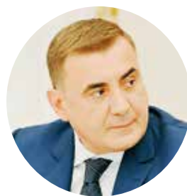
АЛЕКСЕЙ ДЮМИН, ПОМОЩНИК ПРЕЗИДЕНТА И СЕКРЕТАРЬ ГОССОВЕТА

Речь идет о пожизненном privilegiрованном статусе для