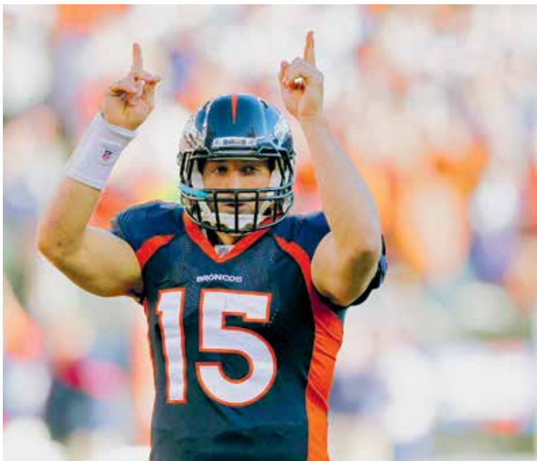
Молитвенная поза квотербека Тима Тиббу – опустившись на одно колено – стала интернет-мемом

религиозные убеждения, определившие судьбу спортсмена, отражены в удостоенном премии «Оскар» фильме 1981 г. «Огненные колесницы» британского режиссера Хью Хадсона. В 2002 г., когда Зал славы спорта Шотландии получил первых членов, Эрик стал лидером общественного голосования за звание самого популярного шотландского атлета. Он опередил спринтера Аллана Уэллса (чемпион Игр-1980 на стометровке) и бегунью на длинные дистанции Лиз Макколган (серебряная медалистка Олимпиады-1988 в забеге на 10 000 м).