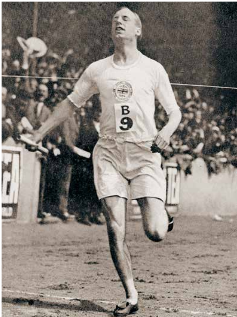
На Играх-1924 Эрик Лидделл по религиозным убеждениям отказался выйти на старт коронной стометровки в воскресенье, но на следующий день стал олимпийским чемпионом в беге на 400 м

живающаяся равенства между верующими и духовенством), который запрещает в этот день недели любую активность. Все попытки руководства Олимпийского комитета Великобритании и даже принца Уэльского переубедить Лидделла успехом не увенчались – спортсмен отправился не на стадион, а в храм.