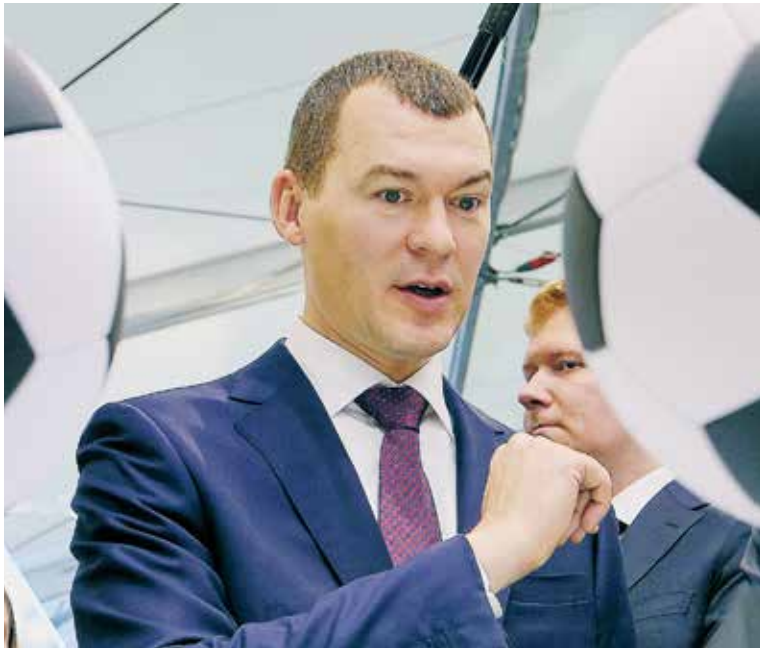
Министр спорта Михаил Дегтярев благословил внедрение «паспортной» системы не только в футболе, но и в других видах спорта

Одной из проблем первых месяцев после введения Fan ID стал порядок оформления карты: личность можно было подтвердить