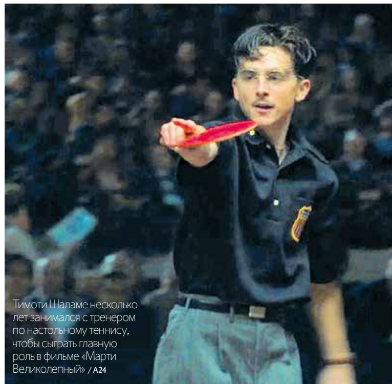
Тимоти Шаламе несколько лет занимался с тренером по настольному теннису, чтобы сыграть главную роль в фильме «Марти Великолепный»

на бесприигрышный вариант – на самого себя. Он вызывал на поединки игроков, которым сначала поддавался, а когда коэффициенты на него росли, он через посредников ставил на себя и добывал победу.